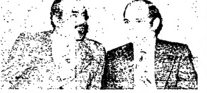
السفير السعودي الشيخ محمد منصور الريح عند اجتماعه مع التيقن ملحم كرم امس

قال السفير السعودي في بيروت الشيخ محمد منصور الريح امس : ان هذه المرحلة من التطورة هي بحث تفرض على كل عربي ان ينصرف لها بكل خلاصه وعقله . . . وعلمنا في لبنان بصورة خاصة ، ان نسهل المشاكل لا ان نهدمها . وعن زيارته الاخيرة للقدس ، قال انه تالقي مع الرئيس فرنجية لبحث معها في قضايا عربية مهم للبلدين ، وشان الاوضاع في لبنان ، واصفا: المنهجية التي في الرئيس فرنجية كقائد للبنان وشقيق للعرب . وقال : اننا نرى في الرئيس فرنجية شخصية عربية متميزة في هذا الوقت الحرج ، وعنده عودات ، طرس التيقن .